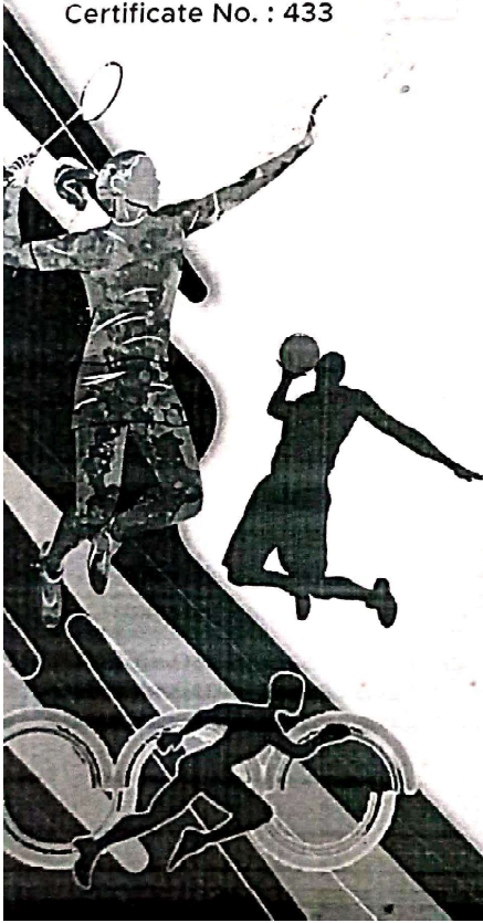
Secretary Pune City Zonal Sports Committee, Pune